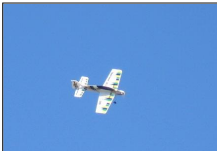
Jeden z modelů, které zazářily na úvod naší drakiády.