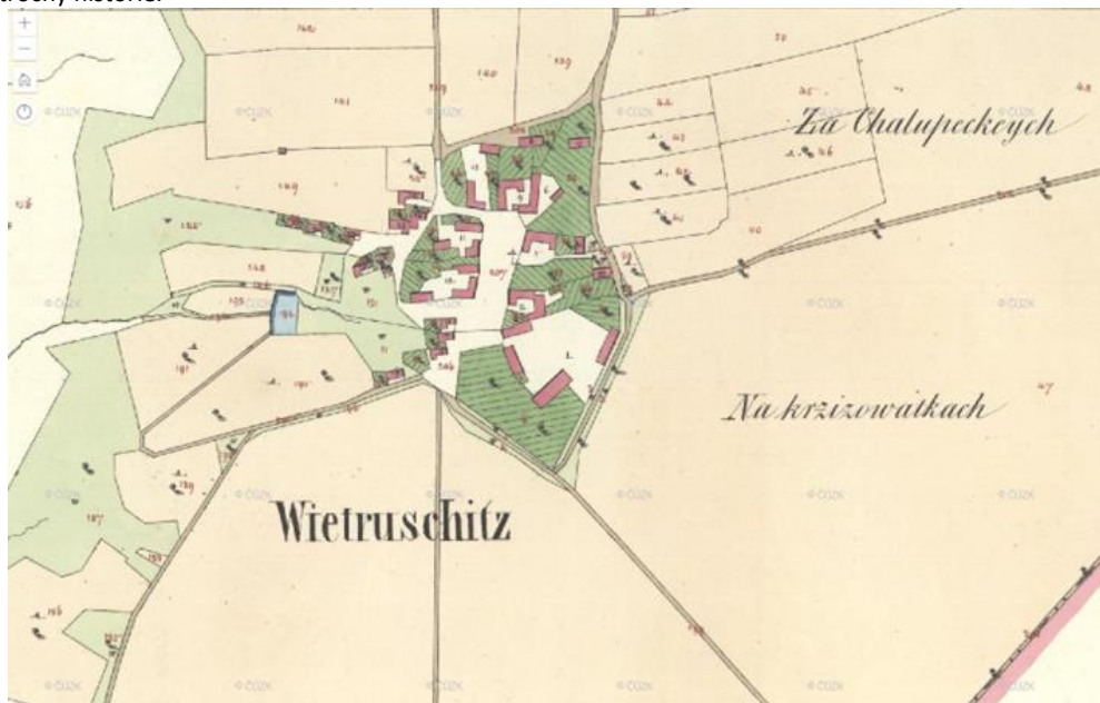
(Mapa z r. 1842)

z větrušické křižovatky do Drast. Do roku 1925 od nás byl na Drasta přístup jen po silnicích z vrboušenými silnými kmeny ovocného stromů a první sjezdovou silnicí od křižovatky do Drast zbudovala naše obec zmíněného roku na své náklady. Asi není na škodu připomenout si proč, včetně nádvaku trochy historie.