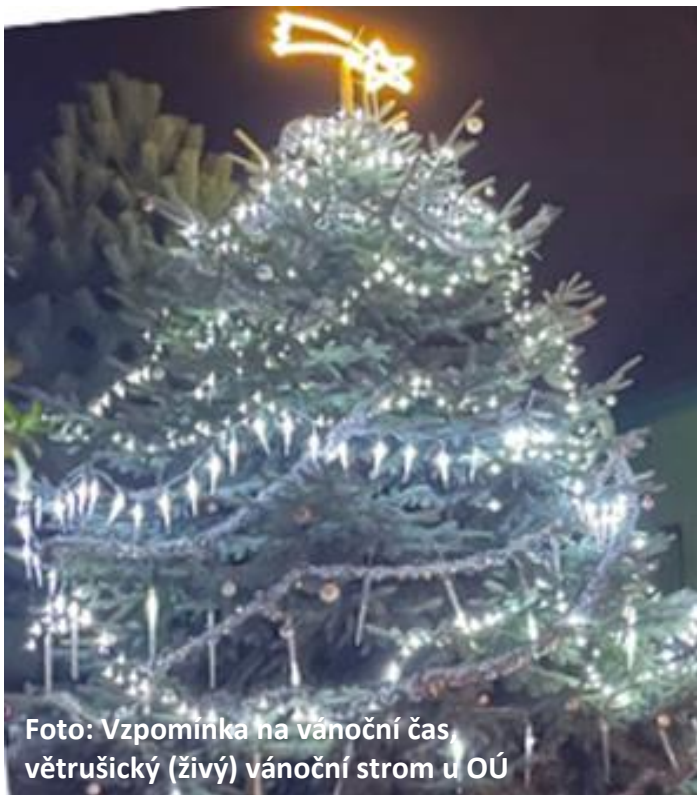
Foto: Vzpomínka na vánoční čas větrušický (živý) vánoční strom u OÚ

čepování svařáku a Romanu Chalupovi za servírování uzeneho a řízečků. Kdybych měl vyjmenovat všechny letošní pomocníky, zabralo by to celou stránku, takže ještě jednou DÍKY VŠEM!