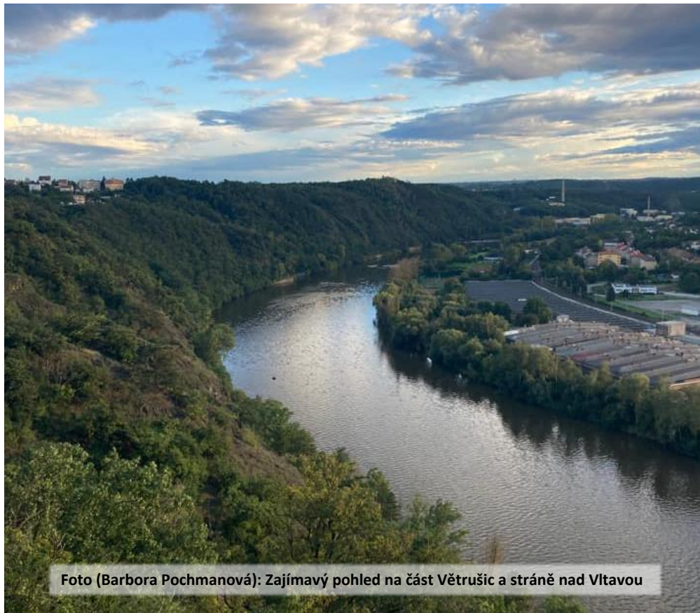
Zajímavý pohled na část Větrušic a stráně nad Vltavou