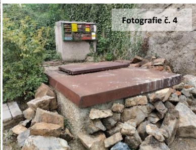
Fotografie č. 4