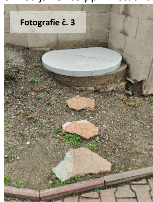
Fotografie č. 3

S Evou jsme našly první studnu pod č. 17 ve Vltavské ulici , dle kroniky rok zřízení 1922 (pozn. v letošním roce byla opravena včetně tarasu u ní a vznikl tam hezký koutek osázený zelení, chválíme). (Fotografie č. 3.)