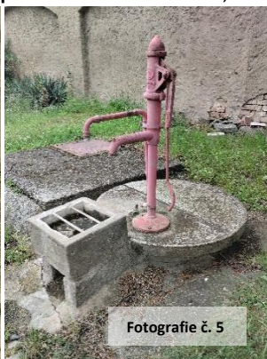
Fotografie č. 5