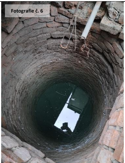
Fotografie č. 6