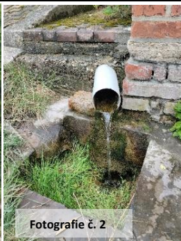
Fotografie č. 2

V roce 1969 žadatelům o vodovodní přípojku uděluje Rada MNV povolení k přípojce s podmínkou, že nesmí na vodovod být připojeno splachovací WC ani koupelna. Vody bylo stále pro všechny málo. Kuriozítka: první a jediný rozvod vody v trubkách (vodovod) před rokem 1969 si v obci pro sebe zařídil nájemce statku č. 1 Jan Zapotil už v roce 1928. Až v červnu 1994 došlo na tomto nejstarším místním vodovodním řadu k havárii a bylo třeba udělat rozvod nový z polyetylenových trubek. V roce 1971 bylo ve čtyřech ulicích položeno dalších 490 m, které byly napojeny až k rybníku. Pro připojení vodovodní sítě byla u studánky postavena vodárnička (nad rybníkem). V roce 1972 bylo položeno dalších 370 m trubek a drenáží byla do rybníku svedena voda, která přetéká ze studánky od vodárničky. Její přítok byl tehdy 4 litry za minutu, což činilo 56 hektolitřů za den. Funkční je i dnes. U malé zděné stavbičky uzavřené starobylými kovanými dveřmi tryská dodnes u cestičky u rybníka voda. (Fotografie č. 1 a č. 2.) To je jediný okamžitý a stálý a bezúdržbový a nekonečný zdroj tekoucí vody, kdyby obec zůstala z jakéhokoliv důvodu bez vody. Ovšem, je nepitná. Ztrácí se pod cestičkou a končí na břehu rybníka (správně řečeno požární nádrže).