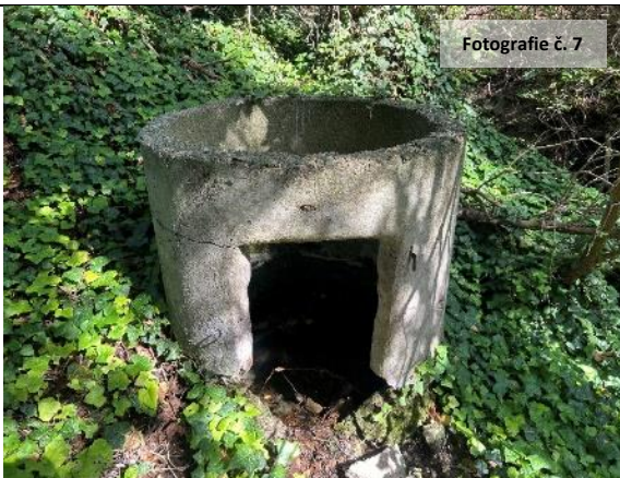
Fotografie č. 7

Druhou studnu pak v dnešní Křížné ulici (dříve se říkalo Za kovárnu) v její spodní části, dle kroniky zřízena v roce 1924. (Fotografie č. 4; v těsné blízkosti studny najdete krásný hmyzí hotel vyrobený p. Frkem.)