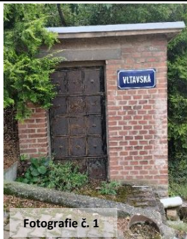
Fotografie č. 1