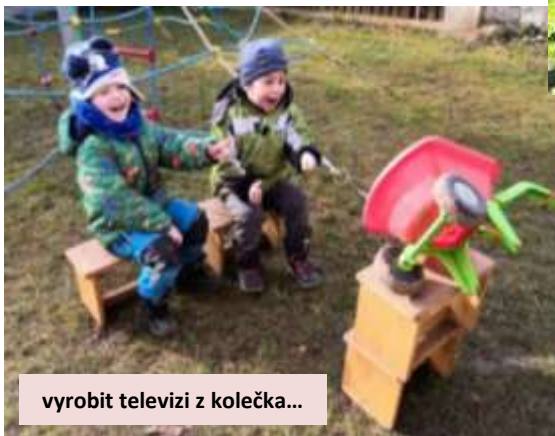
vyrobiť televizi z kolečka...