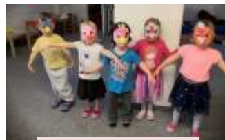
proměnit se v ptáčky...