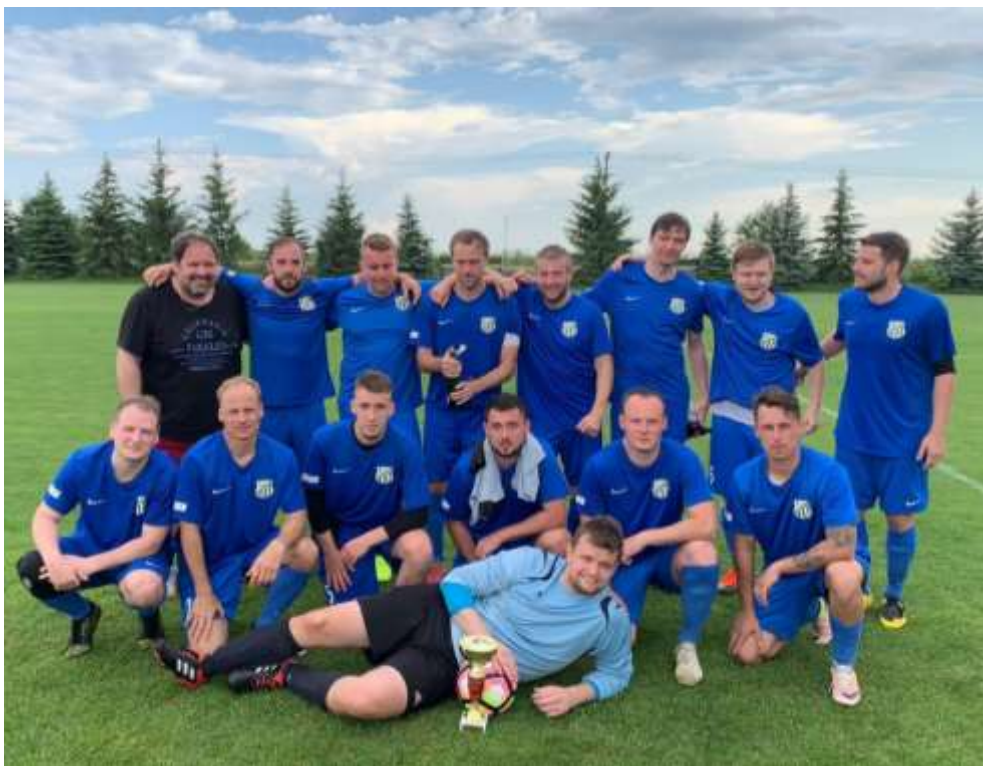
Foto: Jak dopadli větrušičtí fotbalisté na turnaji 13. 6., se dozvíte uvnitř zpravodaje 😊.