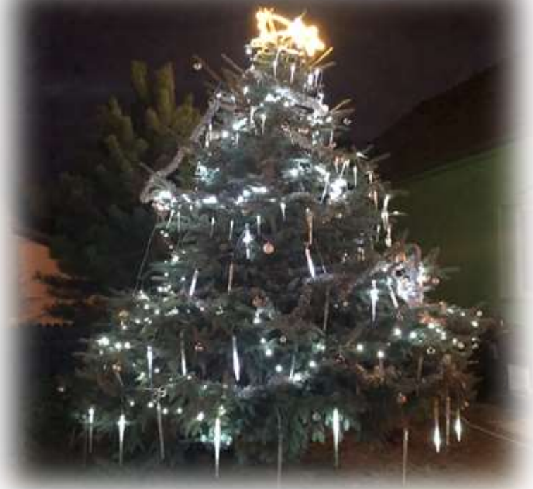
Foto: Stříbrný smrk, který roste u obecního úřadu se oblékl do vánočního šatu a moc mu to sluší!

Děkujeme všem, kteří ho pomohli ozdobit a nasvítit.